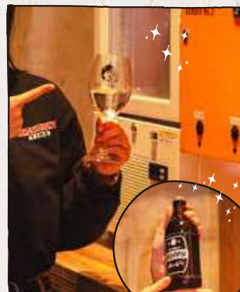
出来上がり! 割り物もあるよ!