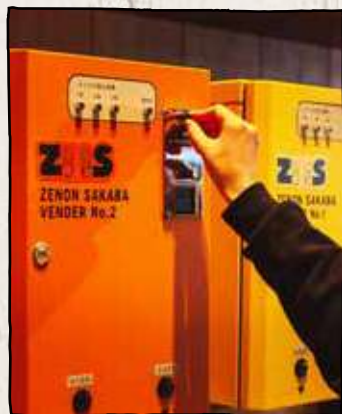
Step 2 お金を入れよう!