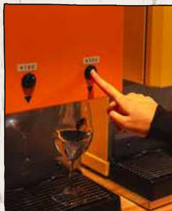
Step 3 ボタンを押すと……