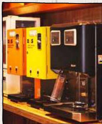
Step 1 お酒を選ぼう!

お手軽ショット以外は、全てジョッキの御利用となります。※お酒の自動販売機は全て税込になります